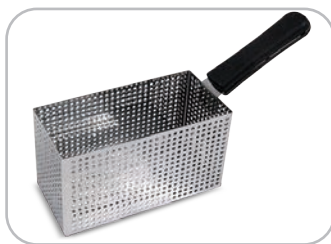
Cestello maxi: di serie per mod. 10 / opzionale per mod. 8 Maxi basket: standard for mod. 10 / optional for mod. 8