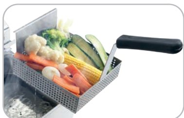
Cestello per cottura a vapore opzionale Optional steam cooking basket mm 200x220 h.60